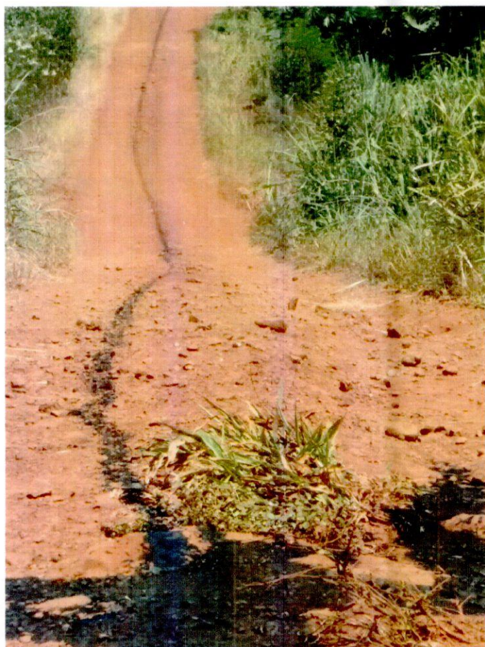
Linha FELIZ NOVO HORIZONTE