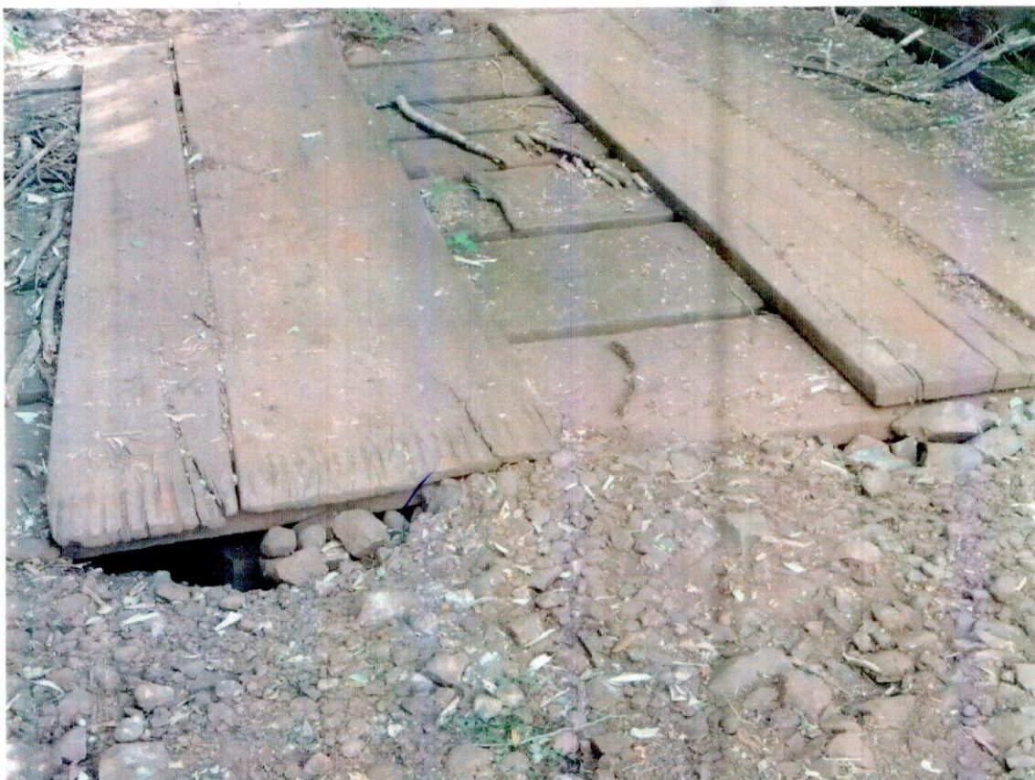
Linha ARARA PROP. FIRMINO PETERS